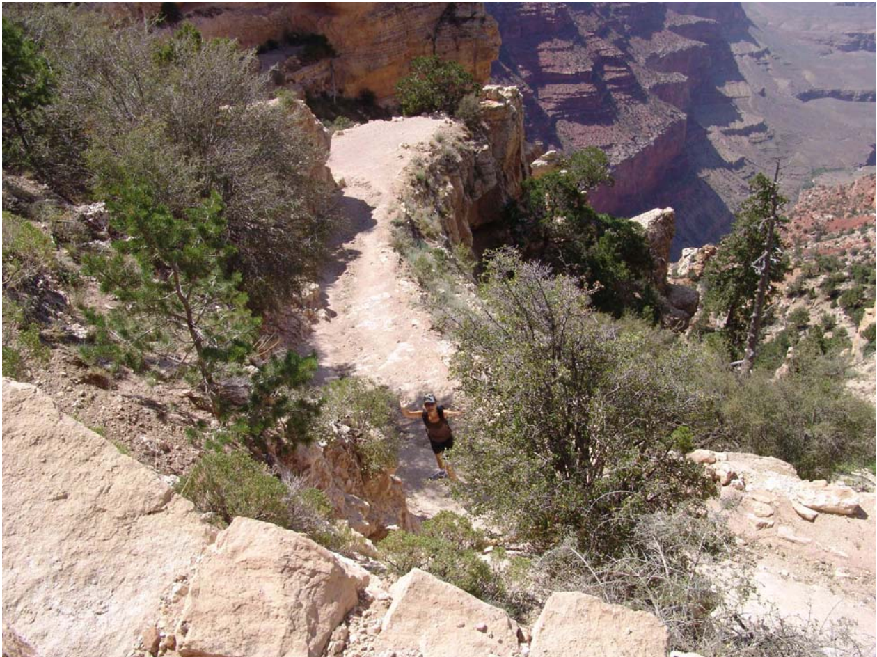
Bilder vom Grand Canyon