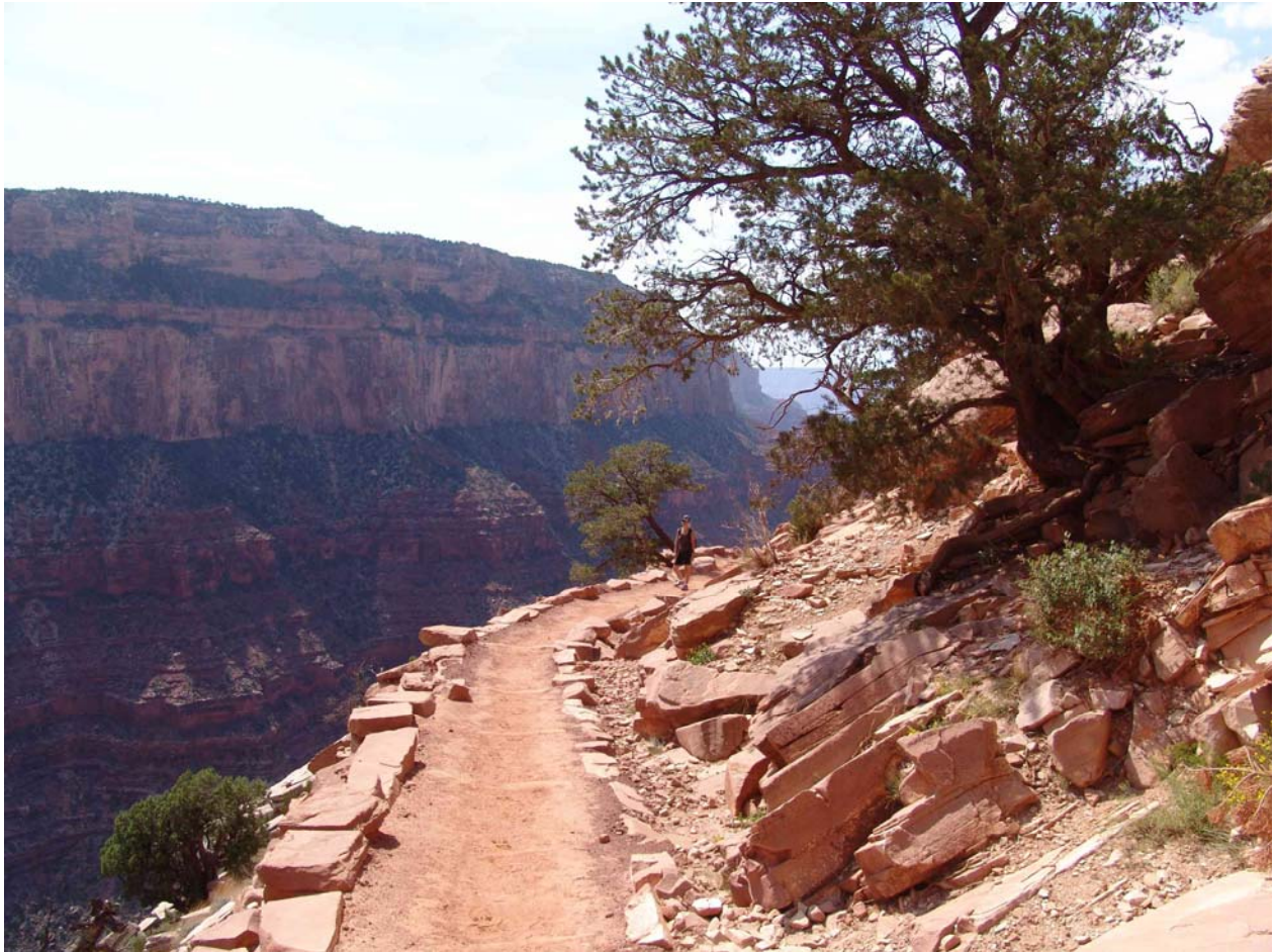
Brian-Angel-Trail am North Rim des Grand Canyon

Ein sportlicher, junger Mensch schafft den Abstieg von der Hochebene in den Grand Canyon bis zum Colorado-Ufer innerhalb eines Tages. Nach einer Übernachtung kann man am nächsten Tag wieder zur Hochebene aufsteigen. Welche mechanische Energie muss man hierbei aufbringen? Welche mechanische Leistung bringt ein Mensch bei diesem Aufstieg auf?